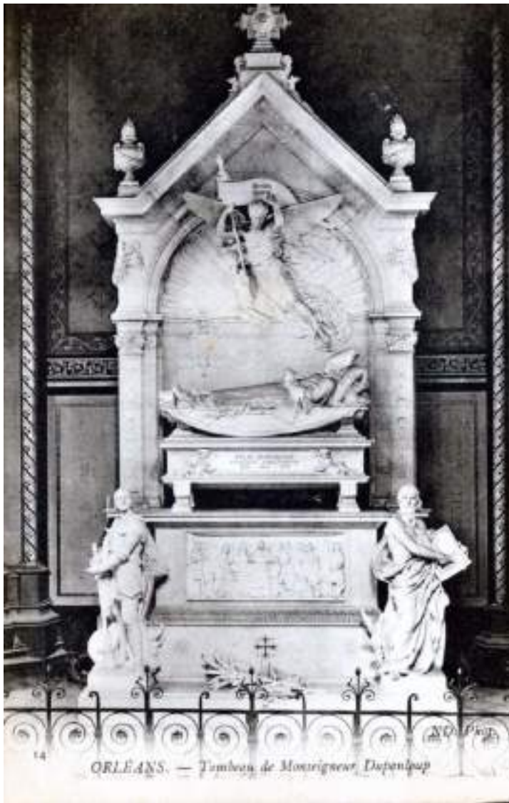
Tombeau de Mgr Dupanloup