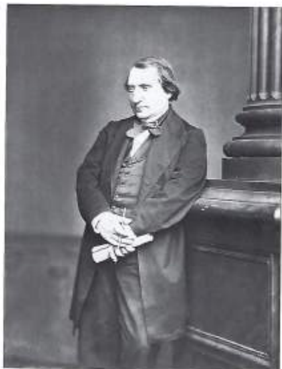
Ernest Renan (1823-1892), écrivain, philologue, philosophe et historien français.