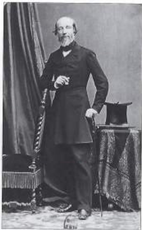
Le comte Alfred de Falloux du Coudray (1811-1886), historien et homme politique français.