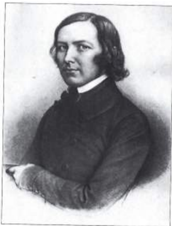
Charles de Montalembert (1810-1870), journaliste, historien et homme politique français, théoricien du catholicisme libéral.