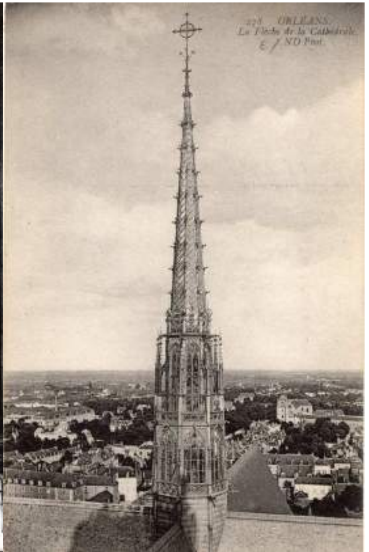
Flèche de la Cathédrale d'Orléans semblable à celle de Notre-Dame de Paris