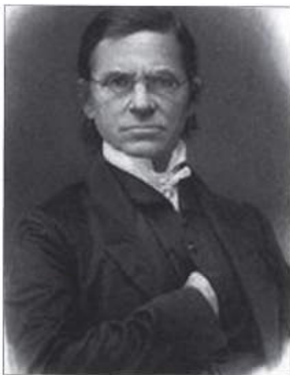
Émile Littré (1801-1881), lexicographe, philosophe et homme politique français, surtout connu pour son Dictionnaire de la langue française : « Le Littré ».